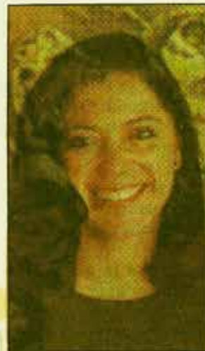
"Obsesión y delirio", de Sandra del Valle