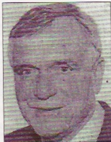
Gobernador Lawton Chiles.

Lo importante es solucionarlos de la mejor manera posible." Cambiamos algunas ideas sobre el crecimiento de la comunidad hispana en todo el estado de la Florida y por supuesto de la inmigración.